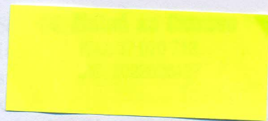
..... podpis oprávnenej osoby za príjemcu